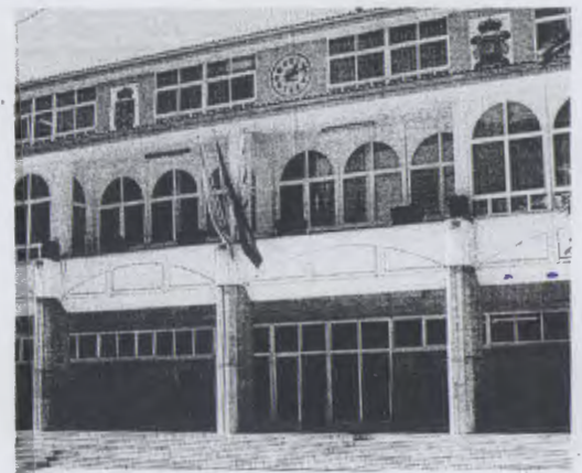
El reloj del concello no funciona desde hace tiempo

En segundo lugar, el PSOE ribeirense ha inquirido al regidor sobre el no funcionamiento del reloj del Concello. Concretamente, han querido saber por qué no se repara o, en caso de no ser posible arreglarlo, por qué no se sustituye por otro. La falta de funcionamiento de un elemento "tan senlleiro" provoca, afirman, "malestar e incertidume" en quien busca la hora en él, especialmente "na xente maior, á hora de recollerse ou para ir a consultas concertadas". ●