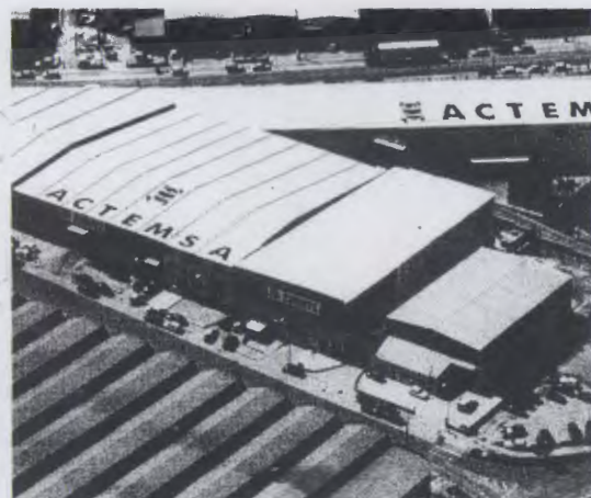
La empresa porense capturará con caña todo el pescado